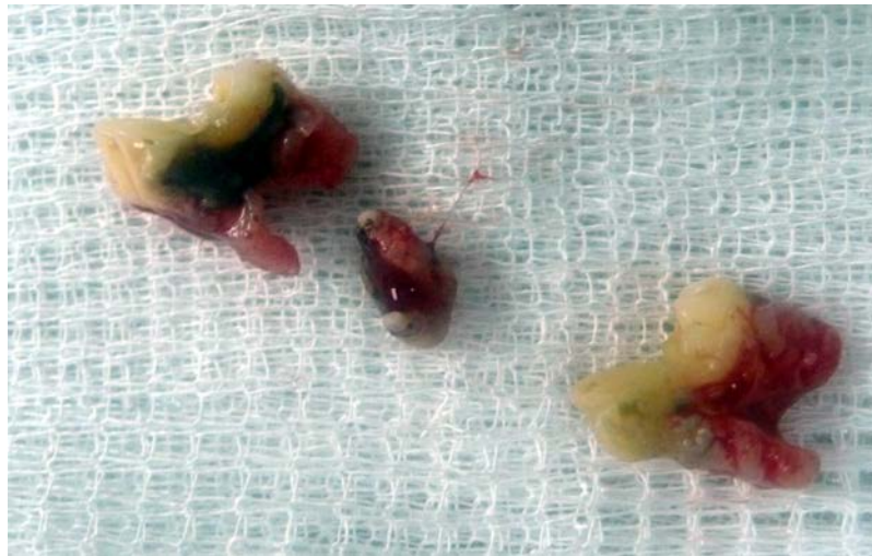
Caso 4: Yorkshire terrier 9 años epulis y limpieza de boca tartrectomía.